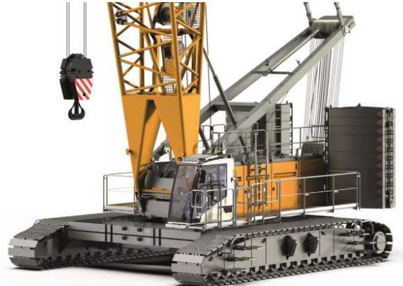
Tragkraft in Tonnen