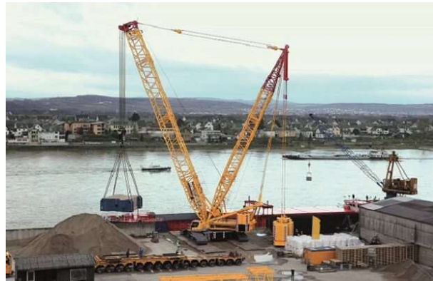
Tragkraft in Tonnen